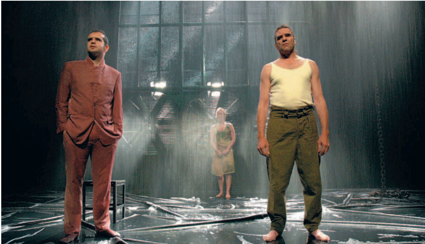
■ Beeld uit Faar . Van de Wijdeven: 'Dat is het thema geworden: hoe verhalen je een donker beeld van de werkelijkheid kunnen aanpraten, tot een derde iemand plots letterlijk het licht komt aansteken en een heel andere wereld toont.'